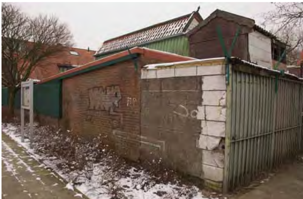
De bovenste foto geeft de huidige situatie weer, gezien vanuit de noordwesthoek (januari 2010).