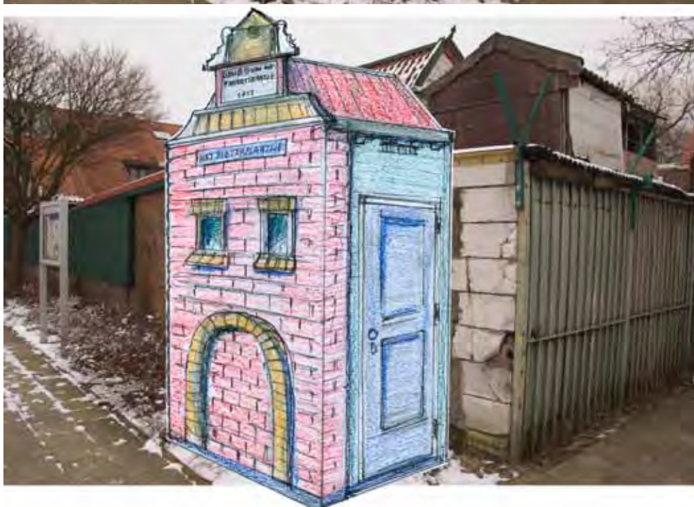
Dezelfde situatie, waarbij een schets van het schuurtje is ingemon-teerd.