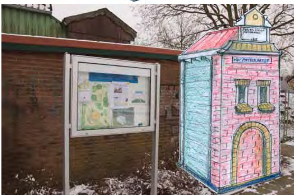
Gezien vanaf de noord-oostzijde, het Pieter-plaatsje-mededelingen-bord staat naast de folie. Zo krijgen de oude gevelsteen, het straatnaambord Het Pieterplaatsje en het mededelingen-bord een centrale plaats op het Pieterplaatsje.